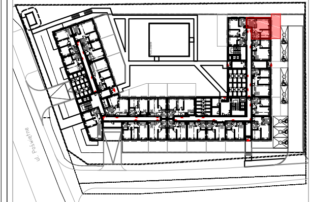
PARTER SCHEMAT - LOKALIZACJA MIESZKANIA