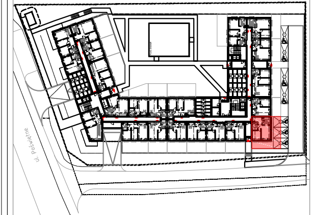
PARTER SCHEMAT - LOKALIZACJA MIESZKANIA